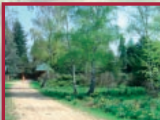
csarabos - nyíres