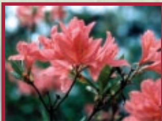
japán azalea változat

büszkélkedhetett. Hagymás és rizómás növények tízezreit, fenyők és lombos fák, illetve Rhododendronok több tucat fajtát és változatát ültették el itt, felismerve a meghonosításra szánt növények igényei és a helyi szélsőségesen savanyú talajadottságok, mikroklíma közötti összefüggéseket. A töretlen gyarapodás a gróf 1933-ban bekövetkezett haláláig tartott.